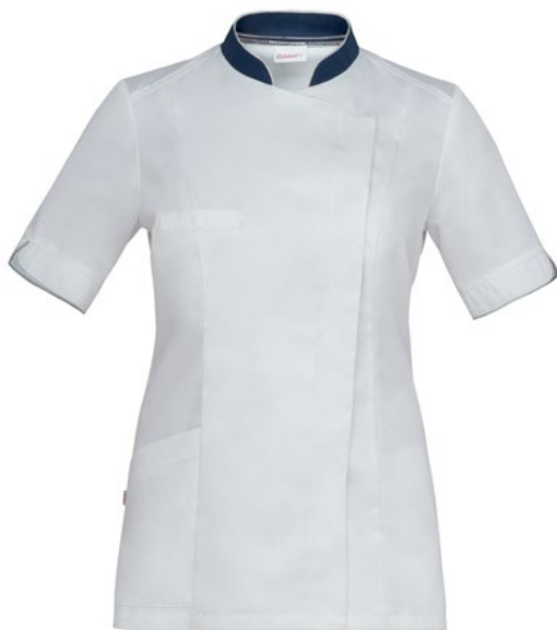
0-004 Bianco Blu