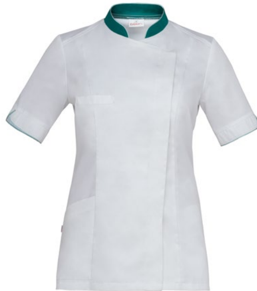
0-002 White Green