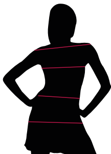
TABELLE TAGLIE E CORRISPONDENZE